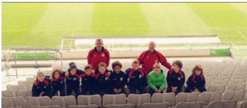
I Pulcini del 2007 in visita allo stadio "Tivoli" di Innsbruck

GIRONE D: A.C. CHIEVO VERONA, A.C. CESENA, F.C. CARPI, ALMA JUVENTUS FANO