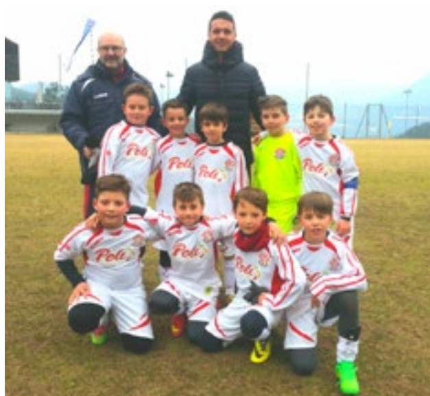
Foto di gruppo per i nostri baby-calcatori del 2007

Nel prossimo numero del nostro magazine daremo ampio resoconto dei risultati conseguiti dalla formazione biancorossa durante il torneo Pecci.