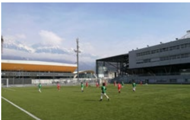
I Pulcini del 2007 in una fase di gioco dell'amichevole vinta contro il Wacker Innsbruck