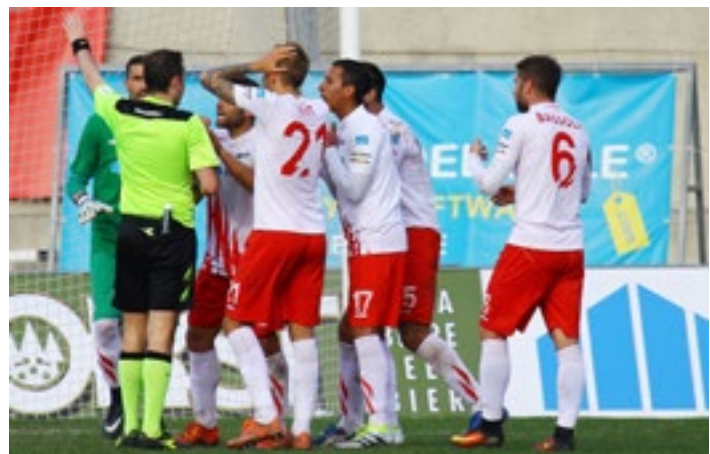
La disperazione dei calciatori biancorossi per il rigore assegnato all'Albinoleffe