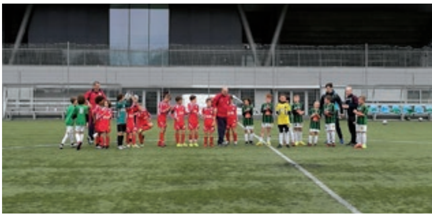
I Pulcini del 2007 schierati a centrocampo con i pari età del Wacker Innsbruck

I Pulcini 2007 si sono aggiudicati il derby con il Wacker e a fine aprile saranno a Legnago per confrontarsi con i pari età di Juventus, Roma, Lazio e Torino. I Giovanissimi del 2003 parteciperanno invece a Pasqua al "Torneo di Pecci" a Igea Marina e sono stati inseriti in un girone di qualificazione con Fiorentina e Sassuolo.