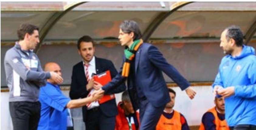
Filippo Inzaghi, „guest star“ al Druso, dove si è fatto apprezzare anche per sportività e disponibilità