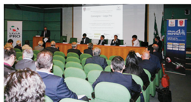
Il convegno organizzato dalla Lega Pro con il Monza