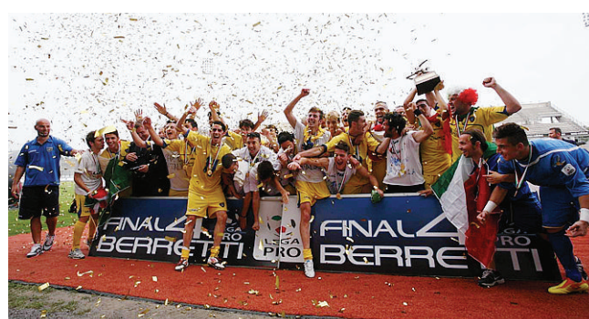
La vittoria della Berretti del Frosinone contro il Cuneo

APRILE - Ad aprile si è tenuto l'incontro con Fifa e Uefa a Tivoli al raduno degli arbitri, fino ad arrivare al 4 giugno alla firma dell'Accordo collettivo con l'Aic. Il documento si caratterizza anche per l'impegno condiviso dalle parti alla lotta ai fenomeni di alterazione dei risultati sportivi mediante pratiche illecite, in particolare per doping e per scommesse sportive.