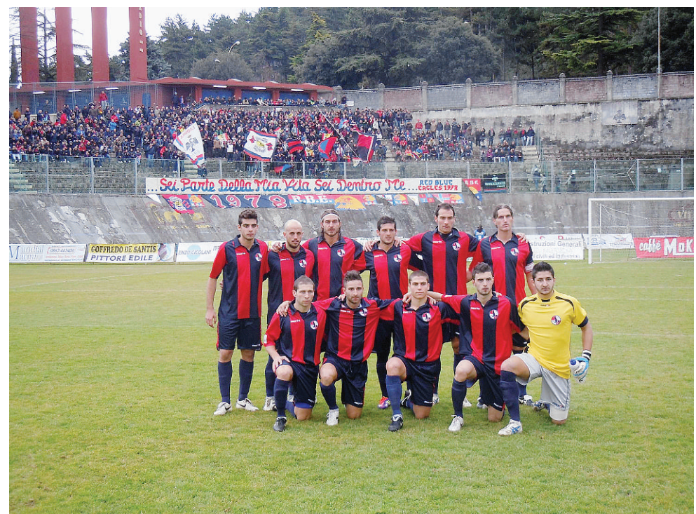
L'undici de L'Aquila schierato sul terreno del Fattori: torneo altalenante quello degli abruzzesi