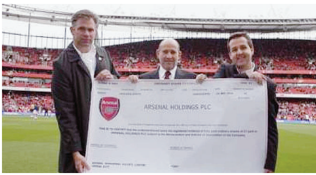
L'acquisizione delle quote societarie dell'Arsenal

I NUMERI - A fine stagione è tempo di bilanci con alcuni numeri. Sono oltre 450 le news diffuse, 400 i comunicati, 50 le interviste mensili a giornali, tv, radio, agenzie stampa e siti. Sono stati 10 i grandi eventi seguiti e comunicati, 15 i workshop valorizzati, 5 convegni, 15 le brochure realizzate, curato il restyling del sito. Sono state, invece, 70 le iniziative che hanno visti i bambini protagonisti in campo.